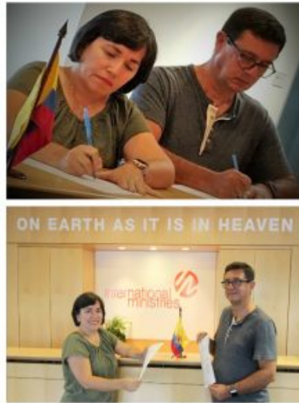
Firmando el acuerdo de servicio el 22 de agosto de 2018.