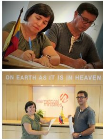
Signing the service agreement on August 22nd, 2018.